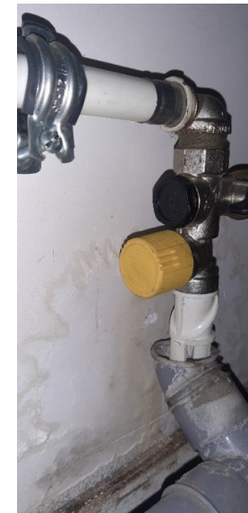
Overdrukventiel CV ketel