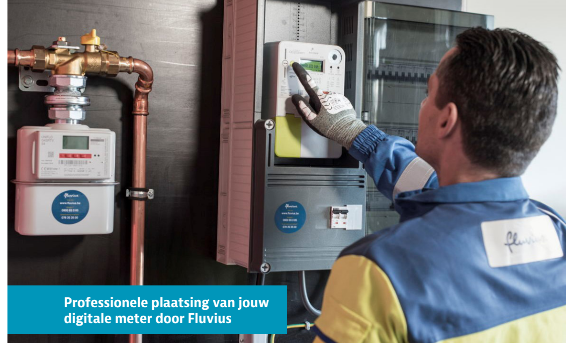
Professionele plaatsing van jouw digitale meter door Fluvius