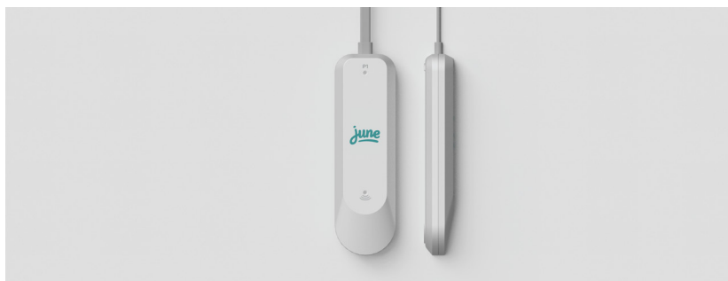
Figuur 1: met de dongle kun je je elektriciteits- en gasverbruik volgen op je computer

Heb je een digitale meter, dan kun je als eigenaar bij de stad gratis een dongle aanvragen. Dit kleine apparaatje wordt aangesloten op je digitale meter, waarna je je verbruik van gas en elektriciteit op je computer of smartphone kan volgen. Door je verbruik in kaart te brengen, leer je welke toestellen veel verbruiken. Zo weet je op welk moment van de dag je je wasmachine het best (= het goedkoopst) laat draaien, en kun je eventueel abnormaal gebruik opsporen. Vraag je dongle aan via www.june.energy/ditur/roeselare .