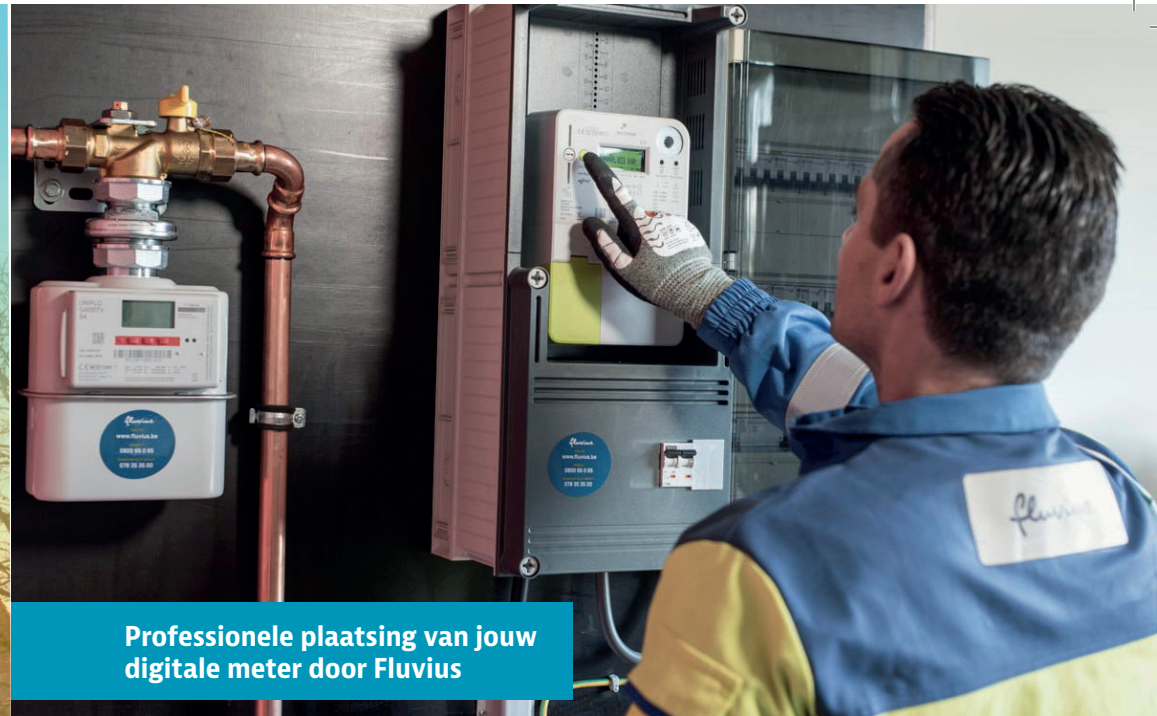
Professionele plaatsing van jouw digitale meter door Fluvius