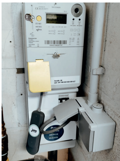
De Dongle meet je energieverbruik.

Het is zover, de eerste dongles zijn geplaatst bij 2 testgezinnen in de wijk! Een Dongle is een digitaal uitlees-apparaatje dat aan je digitale meter bevestigd wordt. Zo maken wij jouw digitale meter slimmer en krijg je een goed inzicht in je energieverbruik en je energieproductie . Alle huurders van de Mandel kunnen meewerken aan dit testproject.